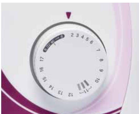
Facile selezione del punto mediante manopola