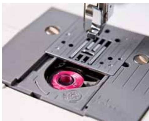
Bobina con carica dall'alto