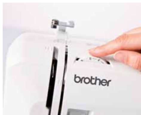
Facile regolazione della tensione del filo

Per ulteriori informazioni, rivolgersi al proprio rivenditore o visitare il sito www.brothersewing.eu .